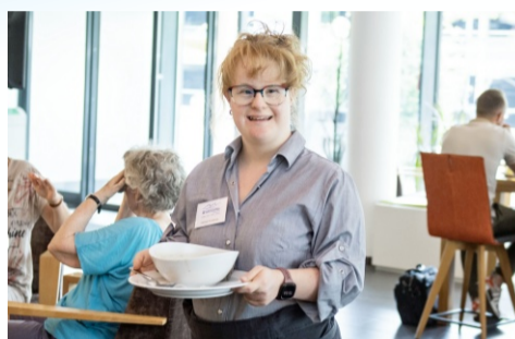
Das Café Kurswechsel feiert Jubiläum Seite 2