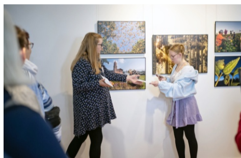
Mit Leichter Sprache durch die World Press Photo-Ausstellung Seite 3