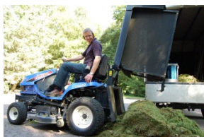
Grundstückspflege von Großflächen und extensiv genutzte Flächen