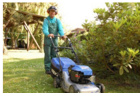
Rasenpflege mit Handmaschinen